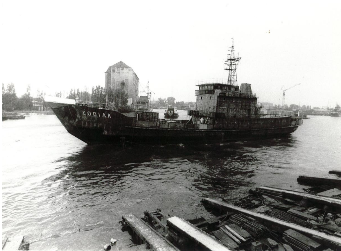
01.01.1982 r. awansowała na stanowisko Kierownika Wydziału Korekty Map Morskich w Urzędzie Morskim w Gdyni. W dniu 08.04.1982 r. w Gdyni przy nabrzeżu Pomorskim, odbyło się uroczyste podniesienie bandery na statku s/v ZODIAK.